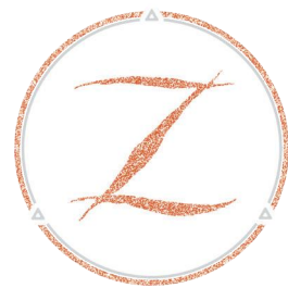
Dissolve® AV 外周刻痕药物球囊