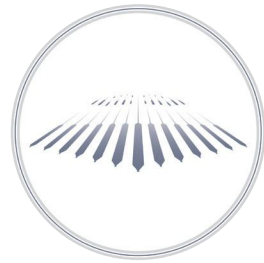
D-Konquer® 外周球囊扩张导管