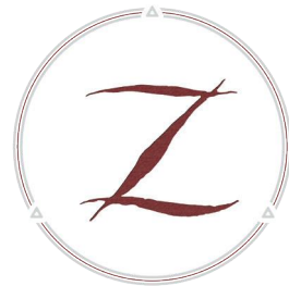
D-Kutting® 刻痕球囊扩张导管